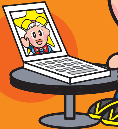
岡山県マスコット ももっち